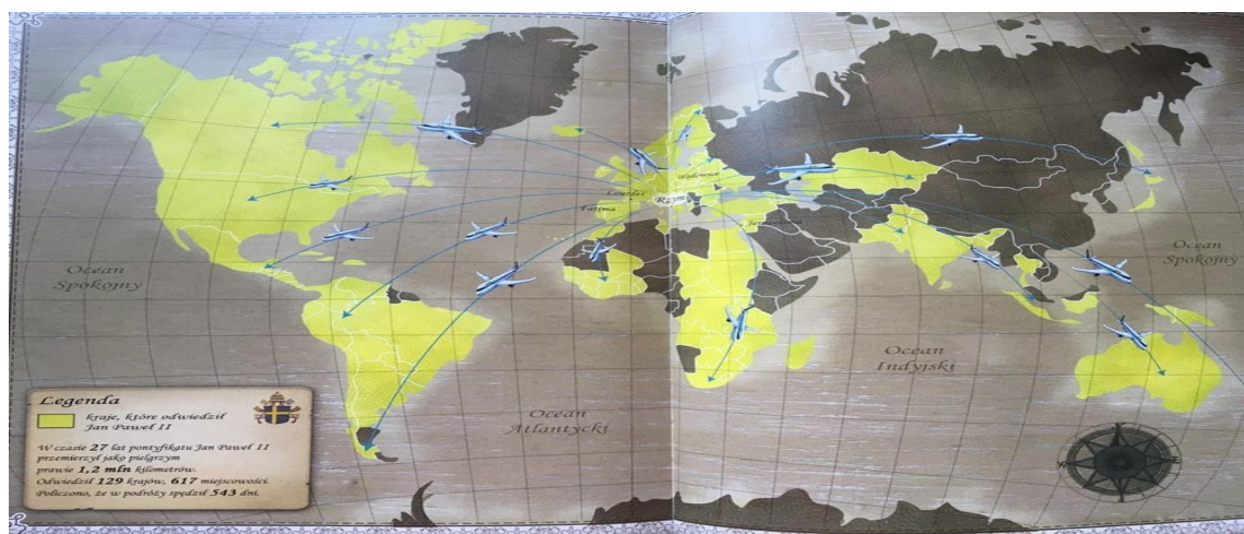
Podróż do Afryki

https://www.youtube.com/watch?v=A2DHSIV_OWE