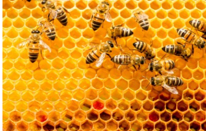
W gniazdach z wosku pszczoły wychowują nowe pokolenia i przetwarzają pyłek kwiatowy na pożywny pokarm