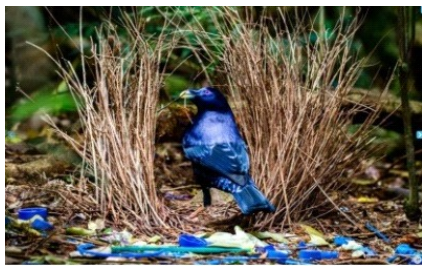
Samce altanków, australijskich psaltrów, aby zwabić samicę, budują altanki, których wnętrza przystosowały się do pędów, kwiatów, a nawet chrząszczami