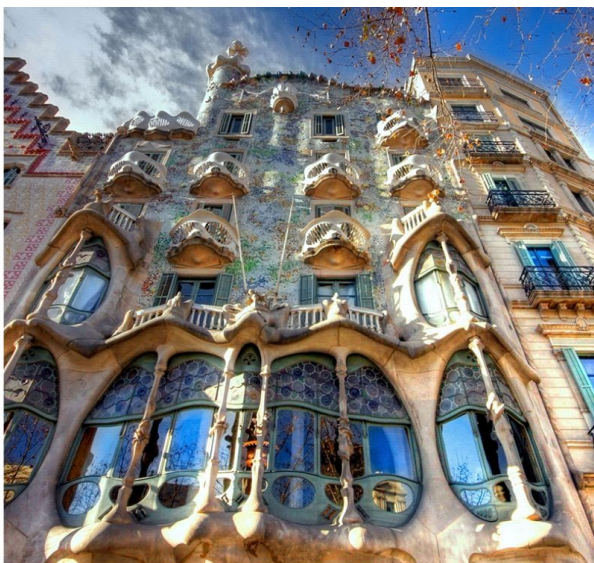
Casa Batlló (czytaj: kasa batlo) (Dom Kości)