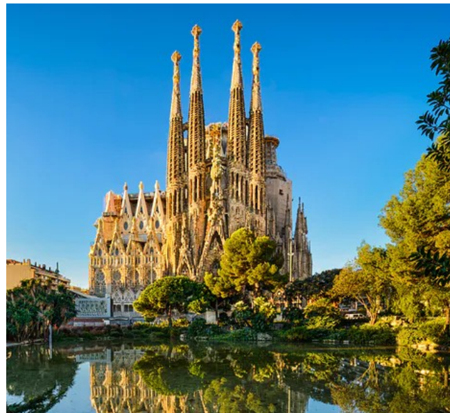
Kościół Sagrada Familia