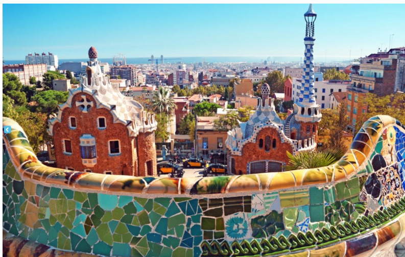
Park Güell (czytaj: gtej)