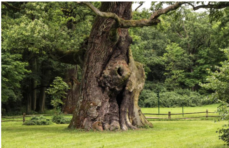
Dęby w Rogalinie

Pomniki przyrody są stworzone przez przyrodę i znajdują się pod ochroną. Są one bardzo cenne ze względów naukowych, zabytkowych oraz kulturowych.