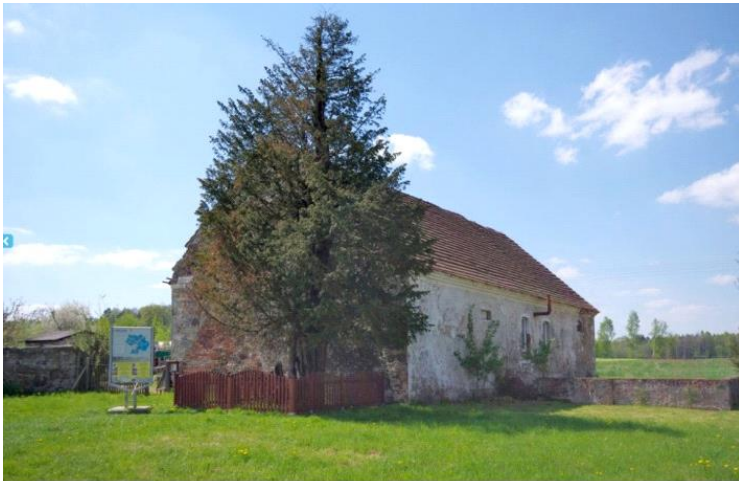
Cis z Henrykowa – najstarsze drzewo w Polsce