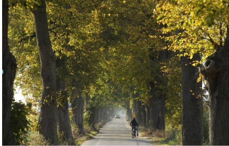
Aleja lipowa w Rzućwie