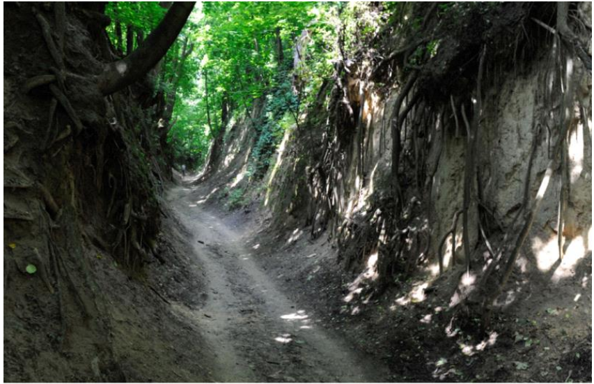
Wąwóz Królowej Jadwigi