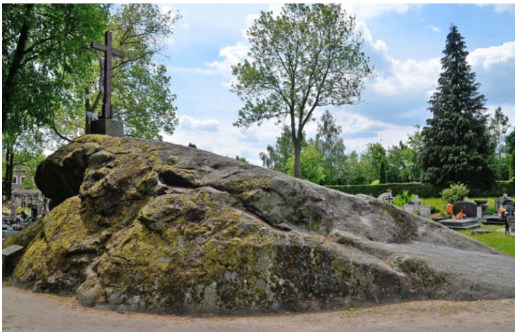
Tryglaw – największy głaz w Polsce

Cis z Henrykowa – najstarsze drzewo w Polsce