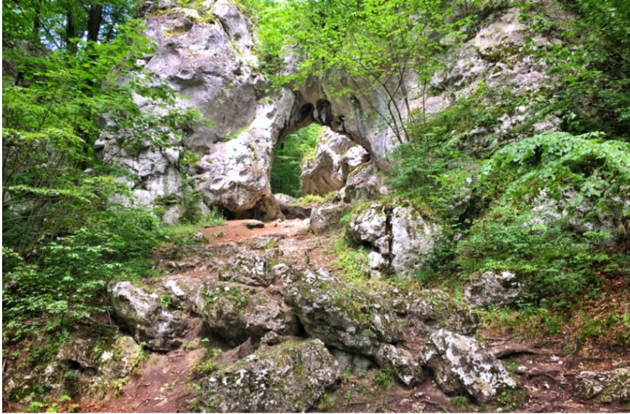
Skałki Brama Twardowskiego