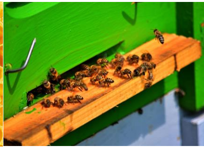
PSZCZOŁY W ULU