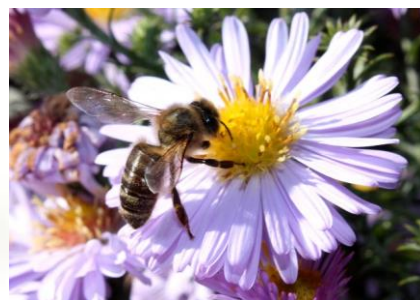
PSZCZOŁA ZBIERA NEKTAR