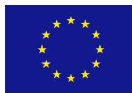
flaga Unii Europejskiej