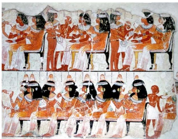
Fragmenty malowideł ściennych z grobowca Nebamuna w Tebach

malowidło na tynku Muzeum Brytyjskie w Londynie ok. XIV w. p.n.e.