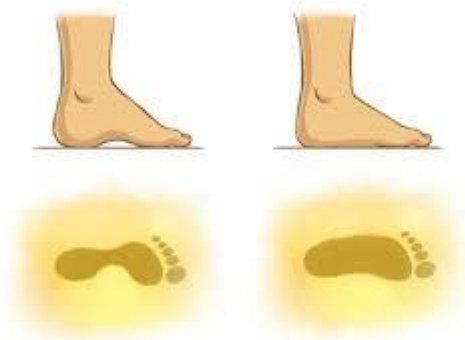
Rysunek 1 Po lewej stopa prawidłowa, po prawej stopa płaska

Prawidłowo ukształtowana stopa nie dotyka podłoża w całości, a opiera się o nie trzema punktami. Dzięki odpowiedniej pracy mięśni i więzadeł, jej kości przyjmują postać łuku, co zapewnia utrzymanie prawidłowej elastyczności podczas chodu. Płaskostopie natomiast ma miejsce wtedy, gdy sklepienia stopy się obniżają powodując, że staje się płaska.