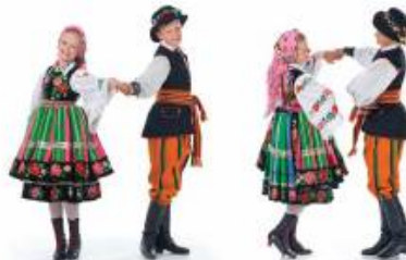
„od się – do się”