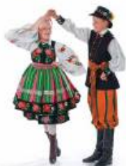
partnerka wiruje pod ręką partnera