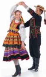
obrotы w parach