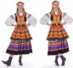
„pięta – palce”