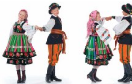
„od się – do się”