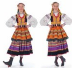
„pięta – palce”