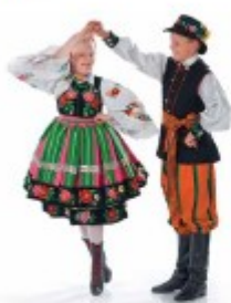
partnerka wiruje pod ręką partnera