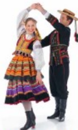
obrot y w parach